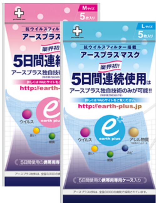
5日間連続使用型 アースプラス・マスク(サイズL/M) 各サイズ5枚入り/1袋 [25日分]

セラミックス複合材料の「アースプラス」は、薬剤に頼らずウイルス・細菌や臭いを吸着して離すこと無く分解させるため、マスクの長期間の利用を実現しました。