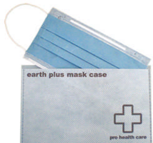
専用マスクケースもアースプラス加工済み